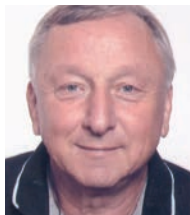
PEARR GEMEINDE RAT ARNFELS

Geboren und aufgewachsen bin ich am Landesgut Remschnigg. Seit der Heirat im Jahr 1979 wohnen meine Gattin und ich in Arnfels. Wir haben eine Tochter und einen Sohn sowie drei Enkelkinder. Nach dem Abschluss der Handelsschule in Leibnitz im Jahr 1973 war ich in der Marktgemeinde Leutschach a.d.W. als Gemeindesekretr ttig. Seit Oktober 2016 bin ich im Ruhestand. Ich beteilige mich an der Organisation von Veranstaltungen und gehe gerne auf die Jagd. Von meinen Eltern wurde der Glaube weitergegeben, mein Vater war seinerzeit Pfarrkirchenrat und meine Mutter langjhrige Obfrau der katholischen Frauenbewegung. Mit der Annahme des Pfarrgemeinderates mchte ich als Wirtschaftsrat aktiv die Pfarre mitgestalten.