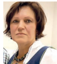
PEARR GEMEINDE RAT LEUTSCHACH