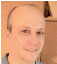
PEARR GEMEINDE RAT LEUTSCHACH